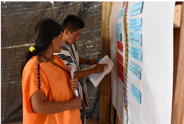
Participantes del curso, de la parte baja y alta de la cuenca del río Ene

Desde su inicio, el proceso formativo ha convocado a más de 140 participantes provenientes de las 45 comunidades nativas de la cuenca del río Ene, incluyendo integrantes del Comando del Sistema de Alerta Temprana (SAT-CARE), jóvenes de 18 a 29 años y mujeres de la iniciativa Acción Mujer Asháninka del Ene (AMA ENE).