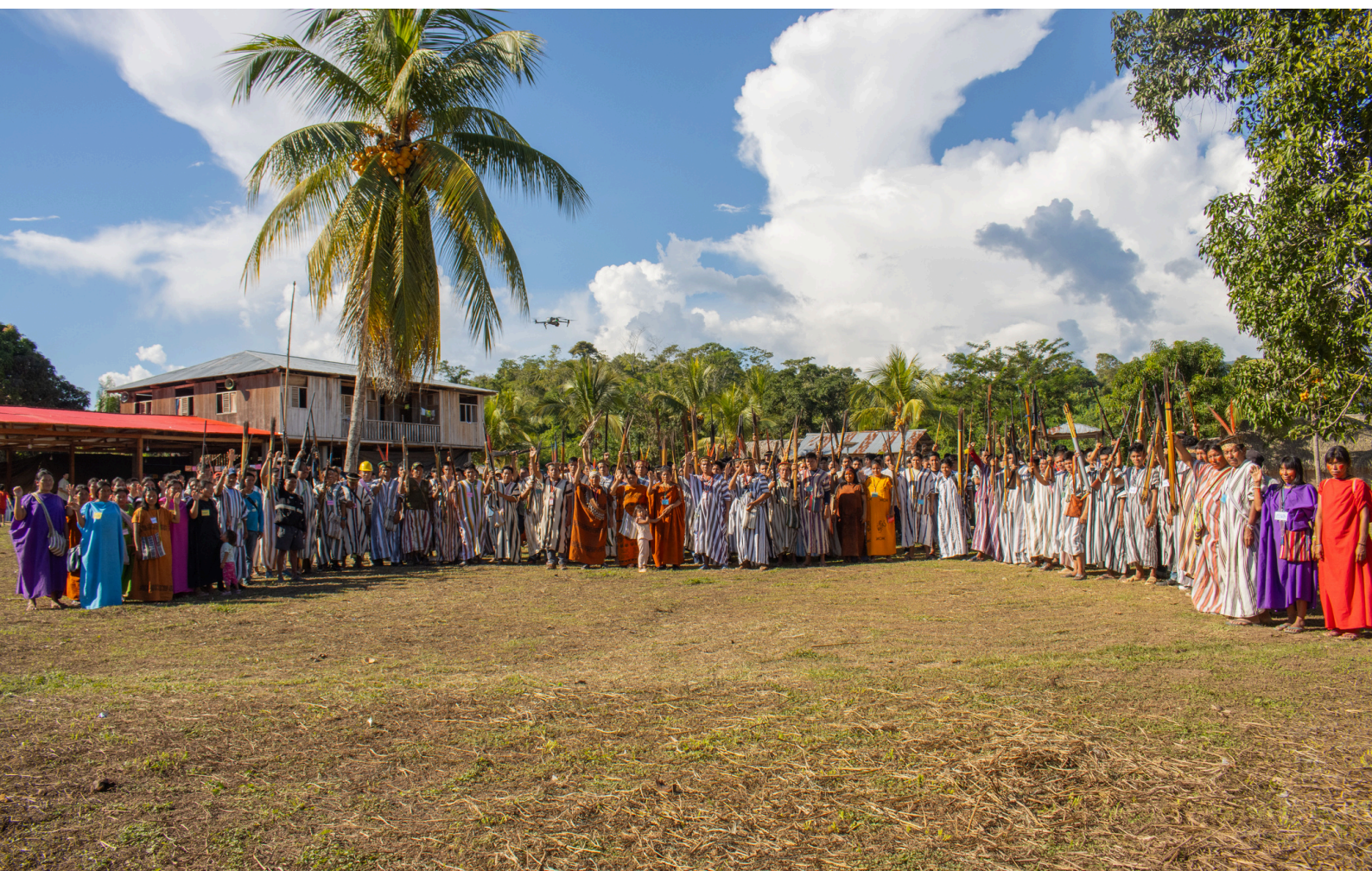
Comuneros y comuneras asháninkas de las 45 comunidades nativas de la cuenca del río Ene