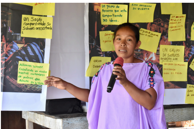
Mujeres y jóvenes líderes participaron activamente del primer módulo del curso Gobernanza y Defensores

Durante estas sesiones, se abordaron temas relacionados con el Estatuto Comunal, el rol de las personas defensoras de derechos humanos, el Mecanismo Intersectorial para la Protección de Personas Defensoras, así como conceptos vinculados al Estado, gobierno e incidencia política indígena.