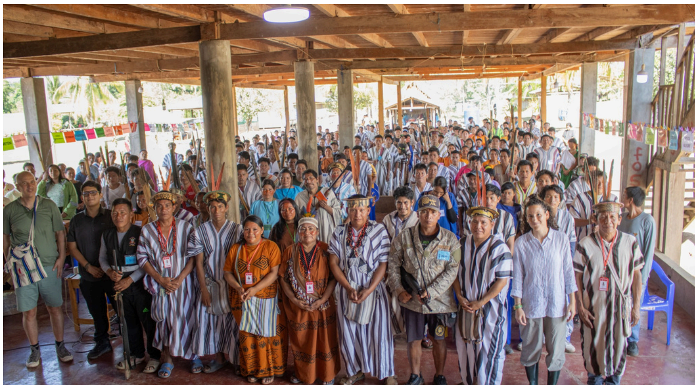
Autoridades y funcionarios del Estado en el XXX Congreso Ordinario CARE 2026

La comunidad nativa de Boca Saniveni, en el distrito de Pangoa, fue sede del XXX Congreso Ordinario de la Central Asháninka del Río Ene (CARE), un espacio de encuentro y toma de decisiones que congregó a líderes y lideresas indígenas, autoridades comunales, representantes del Estado y organizaciones aliadas para fortalecer la gobernanza, el desarrollo y la defensa territorial de la cuenca del Ene.