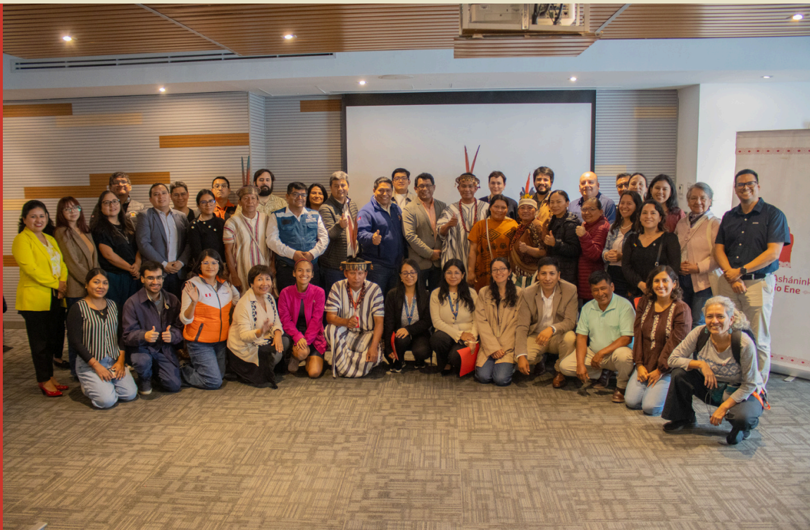
Fotografía oficial del evento de presentación del VISOR CARE