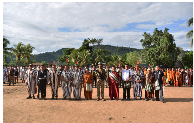
Autoridades, representantes indígenas y comunidades durante el XXX Congreso Ordinario de CARE, fortaleciendo la participación y defensa territorial.