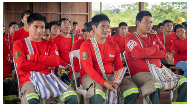
Desarrollo de los módulos I y II del curso PAAMARI