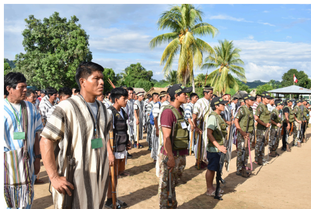
Comités de Autodefensa de la cuenca del río Ene