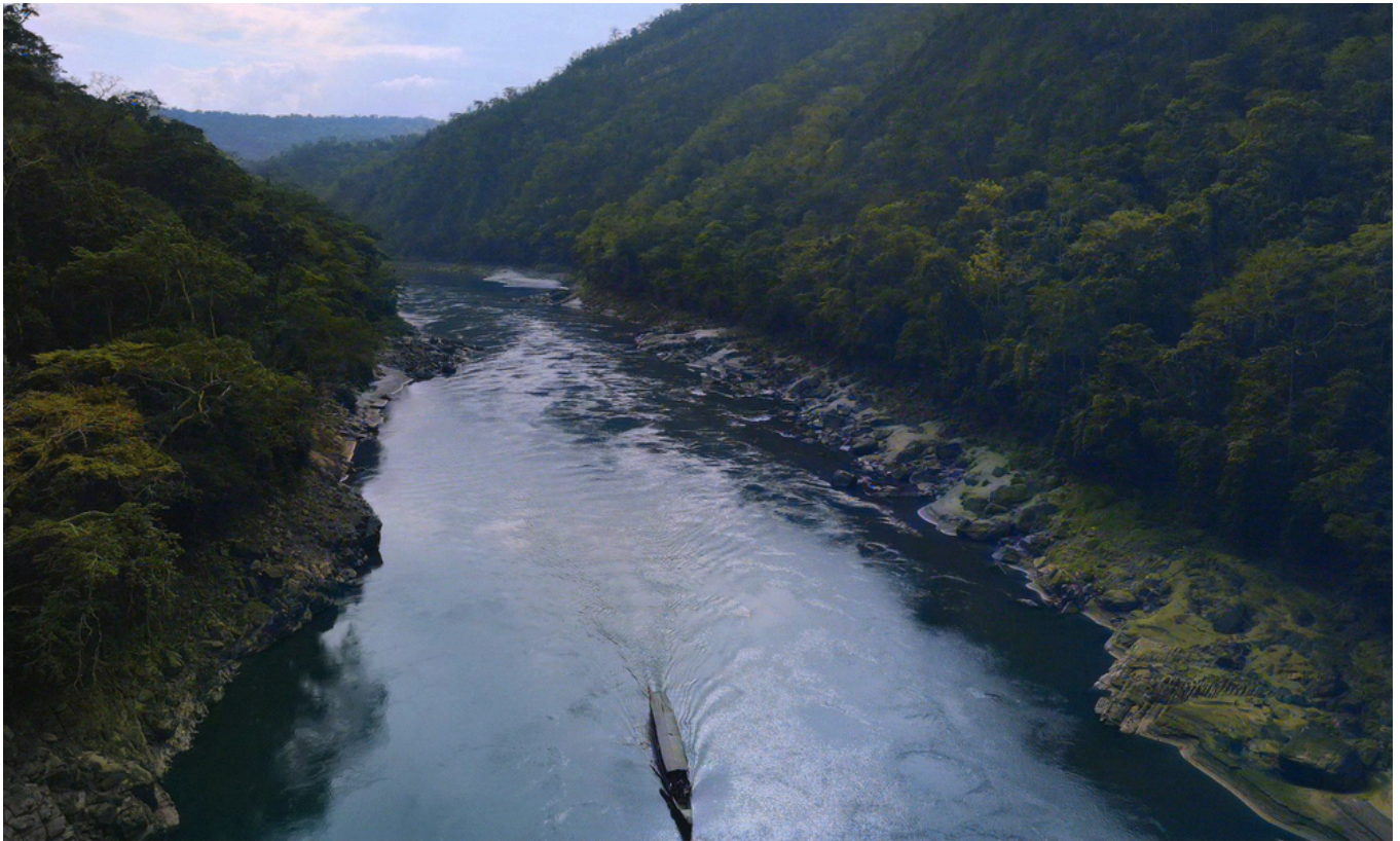
Vista aérea del cañón de Pakitzapango en la cuenca del río Ene

La iniciativa fue retirada oficialmente el 15 de mayo de 2026 y actualmente figura en el sistema del Congreso de la República con el estado de "Retirado por su autor". Para CARE, esta decisión constituye un resultado concreto de las acciones de defensa territorial emprendidas por las 45 comunidades asháninkas de la cuenca del Ene, que durante los últimos meses desarrollaron una estrategia de oposición técnica, organizativa y comunicacional frente a la iniciativa.