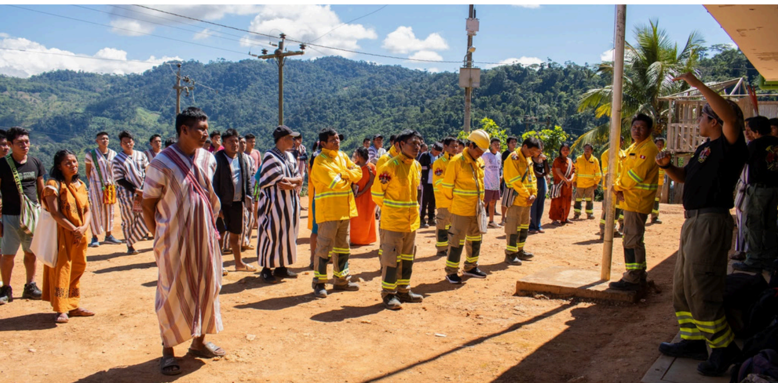
Comuneros y comuneras de las 45 comunidades del Ene participando en el curso PAAMARI

La participación de mujeres asháninkas fue uno de los aspectos más destacados de esta primera etapa, incluyendo representantes de la iniciativa Acción Mujer Asháninka (AMA ENE), quienes se involucraron activamente en los espacios de aprendizaje y fortalecimiento de capacidades para la gestión del fuego en sus comunidades.